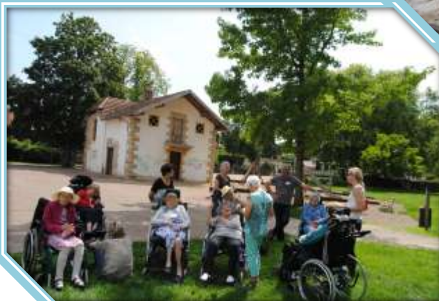
Parc pour tous Gray