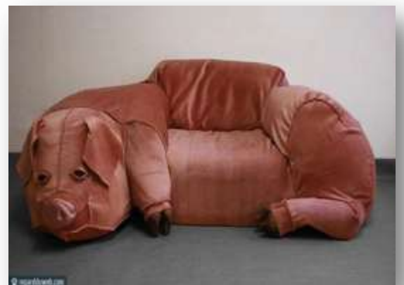
« Canapé cochon !! »