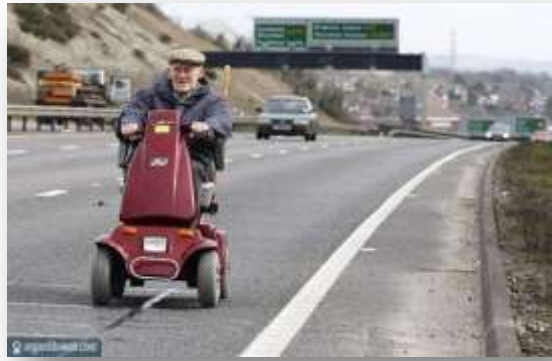
« Ne me doublez pas !! »