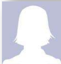
Mme Geneviève PERNIER

Activités manuelles préparations diverses