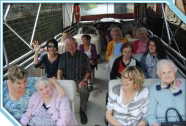
Pénichette « Gray »