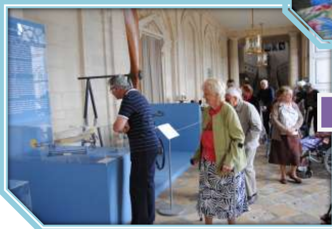
Musée de Champlitte