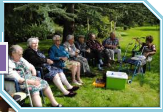
Jardin de l'étang Battrans