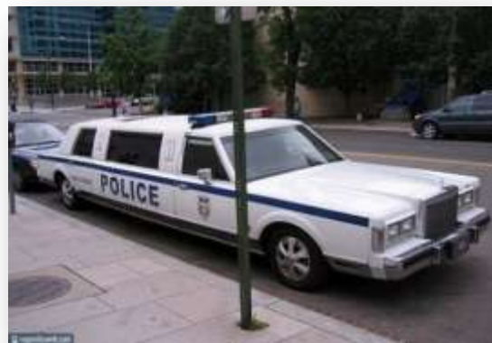
« Limousine de police »