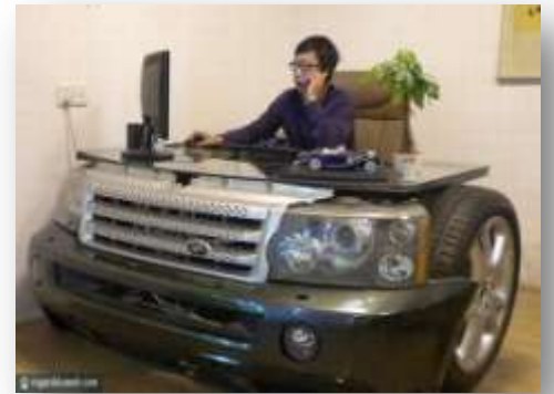
« Passionné d'automobile ! »