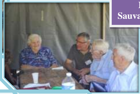
Pique nique Ile Sauvageonne