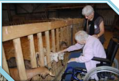
Chèvrerie Saint Maurice sur Vingeanne

Voici une rétrospective en images, des sorties organisées cet été à destination des résidents du Parc, du Belvédère, de la Verrière et du PASA. Je tiens à remercier les bénévoles pour leur aide dans ces sorties durant tout l'été. Je remercie également l'EHPAD de Champlitte pour le prêt du mini bus, adapté pour les fauteuils roulants.